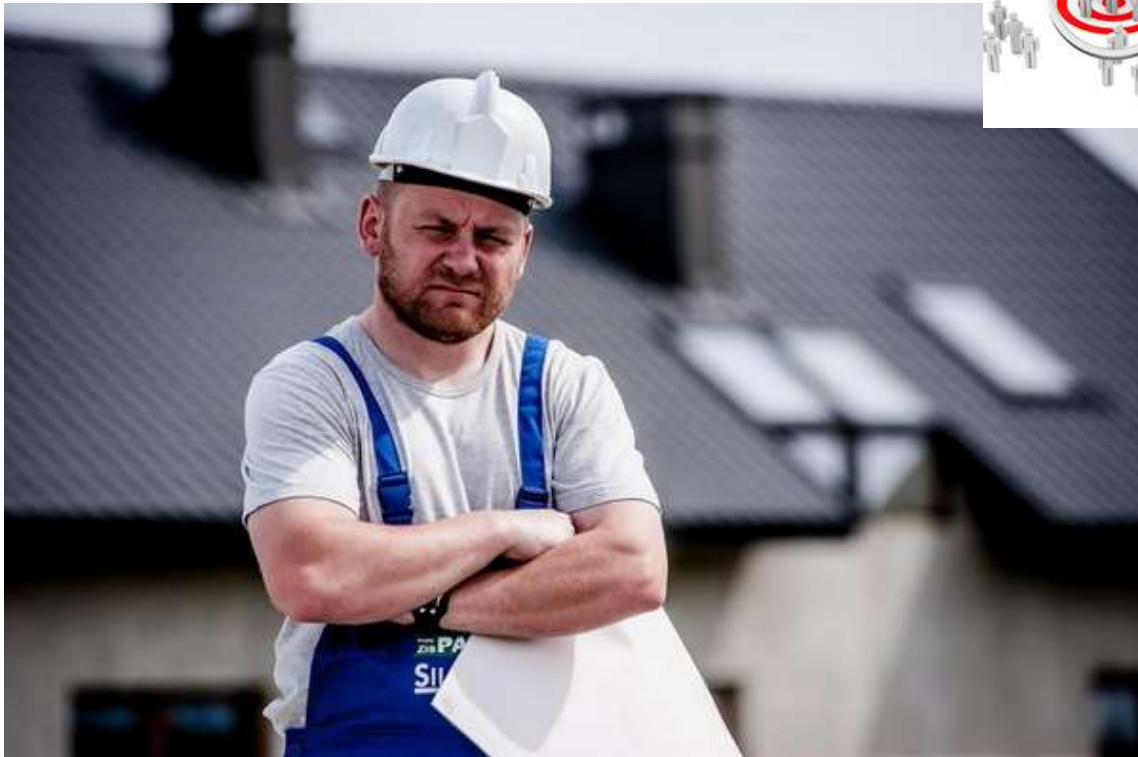
Personengruppe "Häuslbauer auf Kredit" (Risikogruppe)